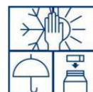
Vorstvrij, koel en droog opslaan. Verpakking goed sluiten