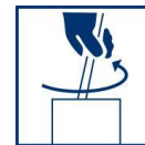
Voor gebruik goed roeren