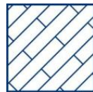
Voor houten vloeren