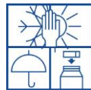
Vorstvrij, koel en droog opslaan. Verpakking goed sluiten