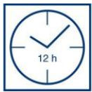
Droogtijd overschil- derbaar na 12 uur